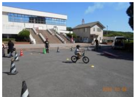
大分県立武道スポーツセンター紹介