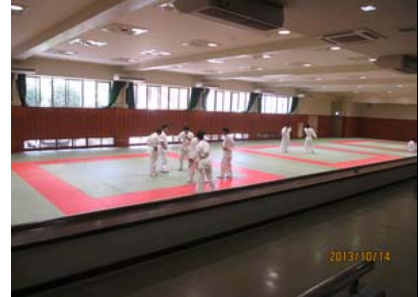
ニュースポーツ体験会