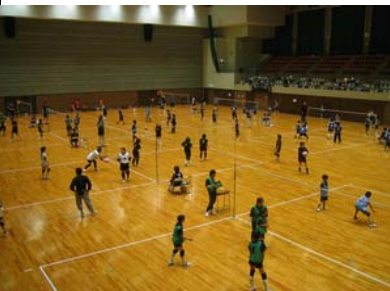
ソフトバレーボール大会