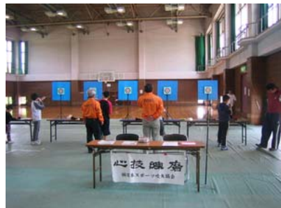
スポーツ吹矢体験会