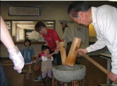
お子様餅つき体験会